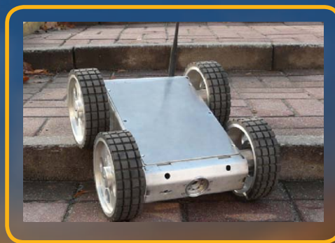
Robot inspekcyjny Pathfinder